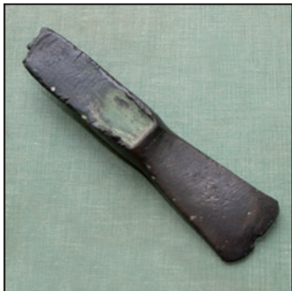
Hache de bronze à talon (v. 1800-700 av. J.-C.) ; L 15,5 cm ; ht 1,7 à 5 cm - Bourbon l'Archambault, musée augustin Bernard -

Les objets de ces périodes (100 000 - 35 000 av. J.-C. et 8000 au Ier siècle av. J.-C.) occupent dès l'origine une place importante dans les collections des musées de l'Allier, reflet entre autres de l'intérêt des mythologies et de la celtomanie ambiante du XIXe siècle.