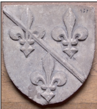
Blason aux armes des Bourbons capétiens, grès, 25 x 23,5 cm - Bourbon l'Archambault, musée augustin Bernard -

Béatrix de Bourbon épouse en 1276 Robert de Clermont, fils de Saint-Louis, faisant ainsi entrer ses descendants dans la famille capétienne. La seigneurie est érigée en duché-pairie en 1327. Les ducs de Bourbon se révélèrent de fortunés mécènes.