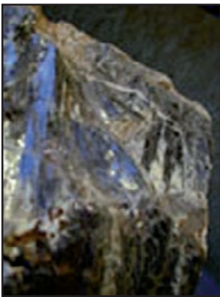
Wolfram dans du quartz - Echassières, Wolframines -

Le thermalisme représente au XIXe et au début du XXe siècle une activité économique majeure.