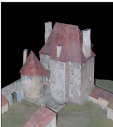
Maquette du château de Fourchaud à Besson (Philippe Velu, François Voinchet), 76 x 120 cm, ht 50 cm - Souvigny, musée -

L'une des premières réalisations de la Renaissance en France est le pavillon Anne de Beaujeu à Moulins. Devant l'unité du royaume, les villes fortifiées font tomber leurs remparts. Après la Contre-Réforme, la vie monastique connaît un regain.