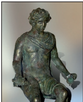
Bacchus en bronze, Ier siècle ap. J.-C., ht 31,5 cm - Vichy, musée municipal -

Plusieurs sites thermaux, Vichy, Nérès-les-Bains, Bourbon l'Archambault, ont révélé des vestiges romains qui ont constitué les bases des collections de cette période.