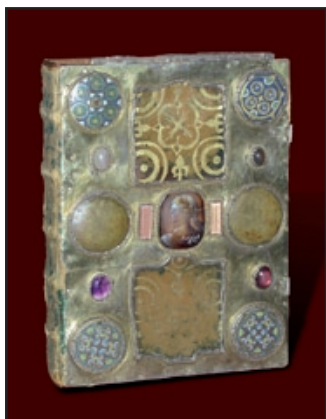
Evangélaire; bois, vermeil, émail, gemme, 29,7 x 22,3 cm, ép. 8 mm, M.H. 1897 - Gannat, musée Yves Machelon -

Le futur Bourbonnais constituait à l'époque une zone frontière entre le royaume franc et l'Aquitaine, se qui explique l'installation de nombreux forts. Plusieurs monastères sont également fondés (Souvigny, Cusset ...).