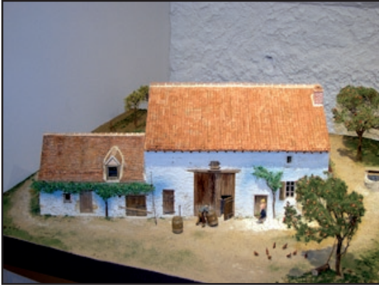
Maquette de maison à Berchère, Saulcet (Françoise Boutet), 76 x 70 cm - Saint-Pourçain-sur-Sioule, musée de la Vigne et du Terroir -

Le Bourbonnais présente le système agro-pastoral commun aux régions du Centre et du Centre ouest, entraînant la formation d'un bocage et la mise en place de métairies.